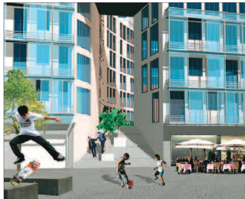
SMITT OG SMAU: To åpninger i fasaden i Kong Oscars gate 81 skal bevare byens tradisjoner med smitt og smau. Dette er inngangen fra Lungegårdsbakken.