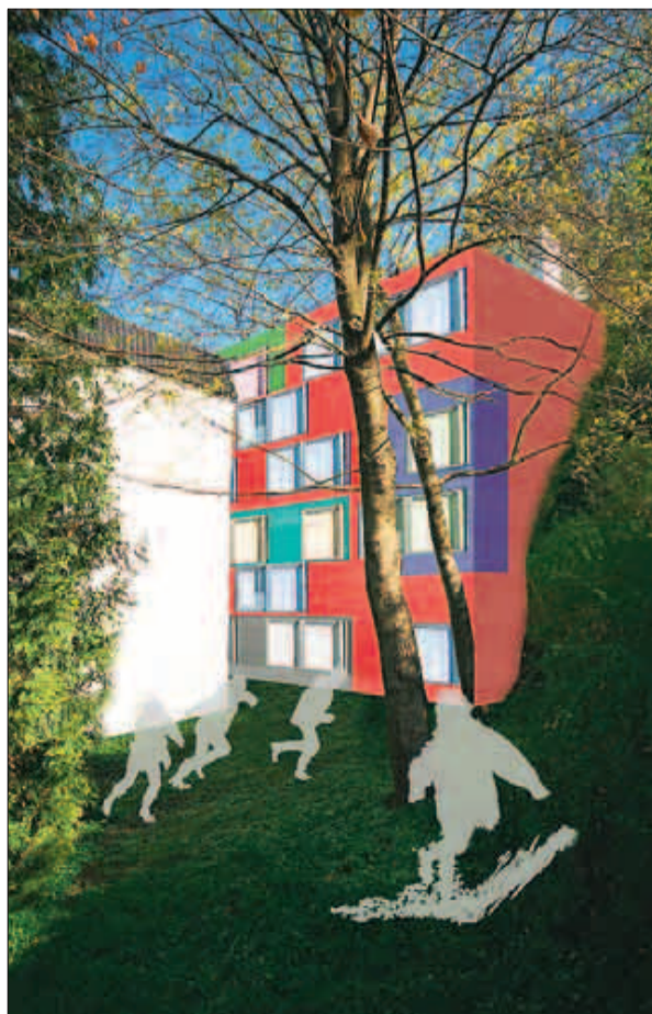
INN MOT FJELLET: En del av utbyggingen av Betanien gamle sykehus skjer ved å skjære inn i fjellet på baksiden av sykehuset og bygge ni etasjer i flukt med fjellet.