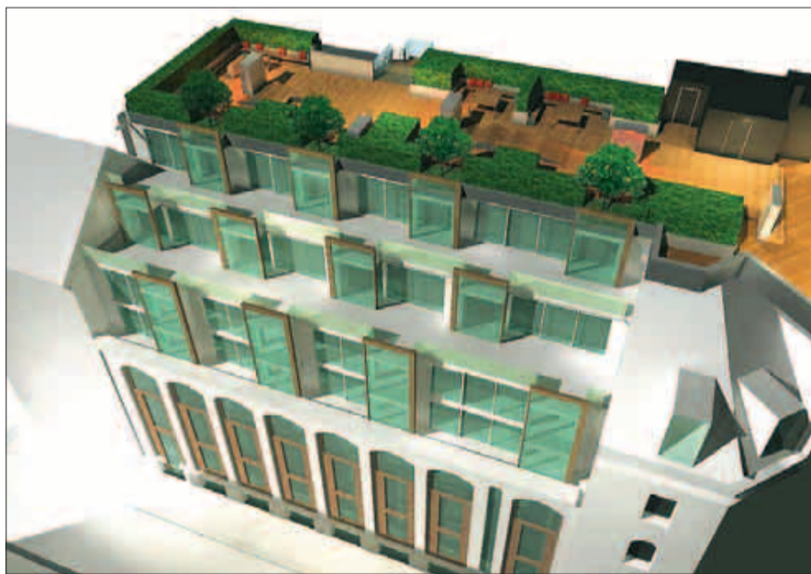
TILBAKEFØRT: Eldoradogårdens fasade blir langt på vei tilbakeført, mens de nye leilighetene kommer på toppen.